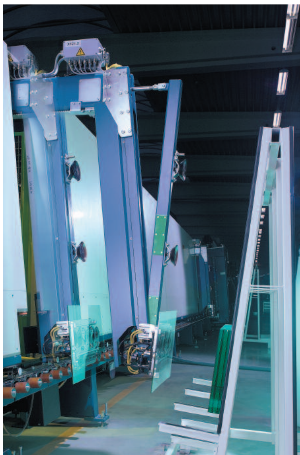
Séparation fiable dû à une mécanique spéciale