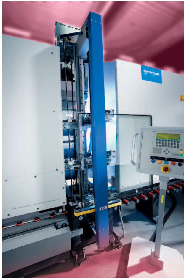
Type DA-HS: Application sur l'arrière du vitrage isolant