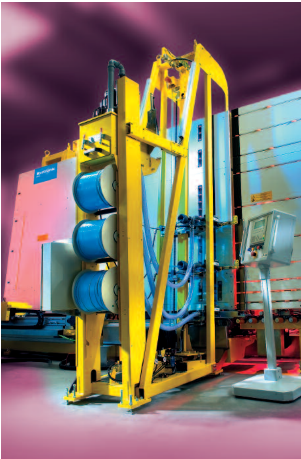
Type DA-VS: Application sur la face avant du vitrage isolant