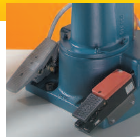
Freie Hände durch Fußtaster-Steuerung