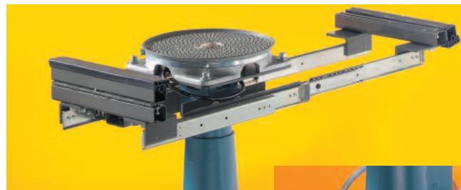
Zweiseitiger Auszug für lange, schmale Einheiten