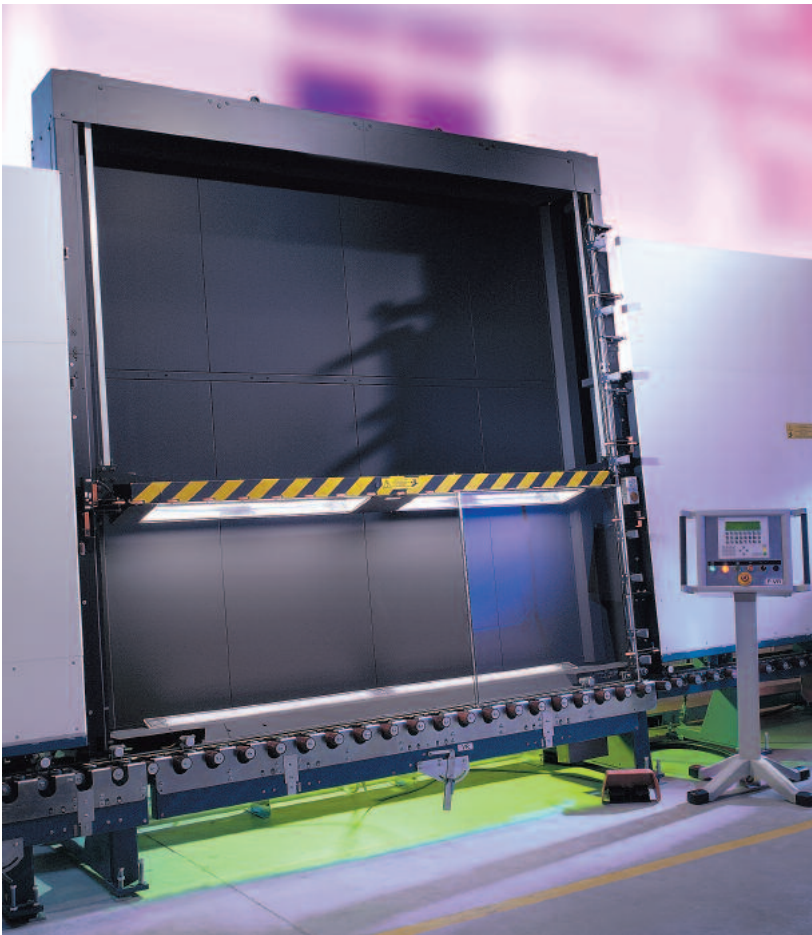
Réglage automatique des barres de butées de cadre pour les différentes épaisseurs de verre