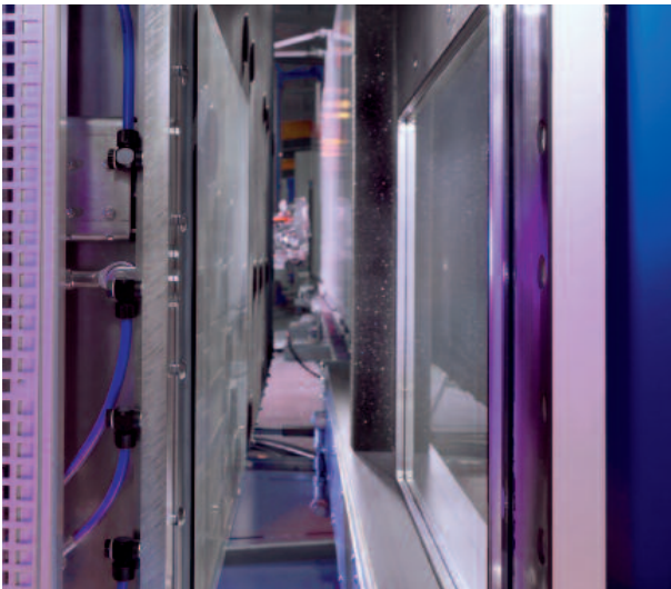
Rechteck-Format in der Presse